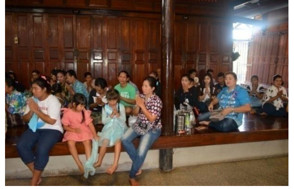
ทำความดีด้วยหัวใจ ลดรับ ลดให้ ลดใช้ถุงพลาสติกและโฟม