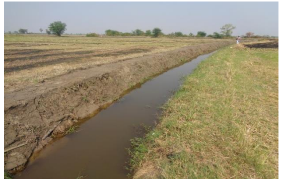
กำจัดวัชพืช ๒ ข้างคลองและขุดดินกันคลองส่งน้ำสาธารณะ (สายบ้านท่ามะเกลือผ่านบ้านนางวิเชียร บัวบังใบ) หมู่ที่ ๑