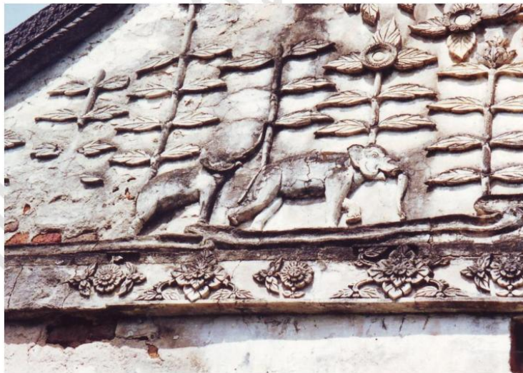
ภาพช้างที่ตกแต่งหน้าบ้านอุโบสถ วัดหนองควง ด้านทิศตะวันออก แสดงภาพช้างคู่ ที่ทำรูป ช้างได้เหมือนจริง ลายรอบเป็นลายดอกไม้ สลับลายประจำยาม ฝีมือค่อนข้างละเอียด