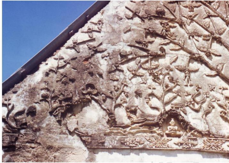
ลวดลายปูนปั้นตกแต่งหน้าบ้านด้านทิศตะวันตก วัดหนองควง เห็นรายละเอียดต้นมักกะลีผล ดอกผลเป็นรูปผู้หญิง แสดงไว้หลายระยะ ทั้งที่เพิ่งตูม ผลิดอก ออกผล มีเฉพาะขา ครึ่งตัว และ เต็มตัว เป็นต้น นอกจากนี้ยังมีภาพนก ภาพกิลเลนลายเมฆ