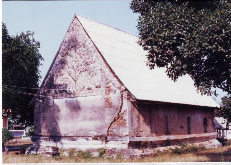
ทางด้านหลังของอุโบสถวัดหนองควง สภาพชำรุดมาก เครื่องลายองไม่เหลือหลักฐานให้เห็น