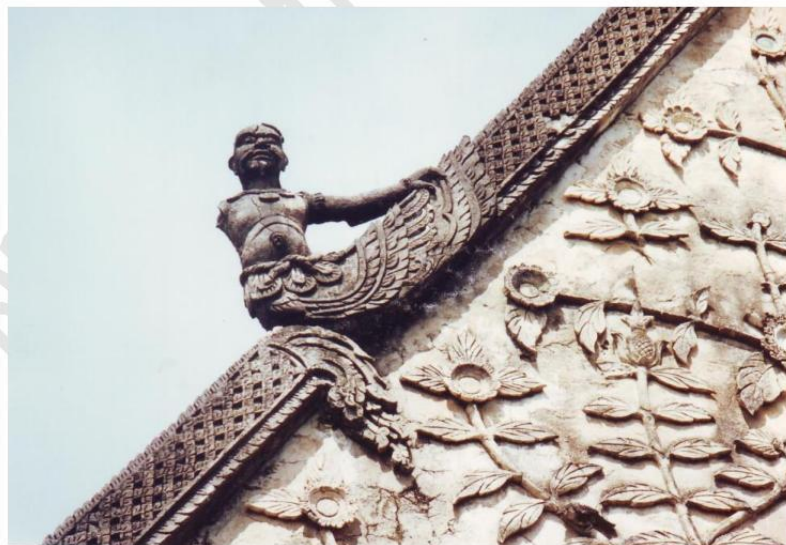
ประติมากรรม ประดับตรงกลางจั่ว (เครื่องลำยอง) ของอุโบสถวัดหนองควง เป็นรูปกษัตริย์ครั้งตัว