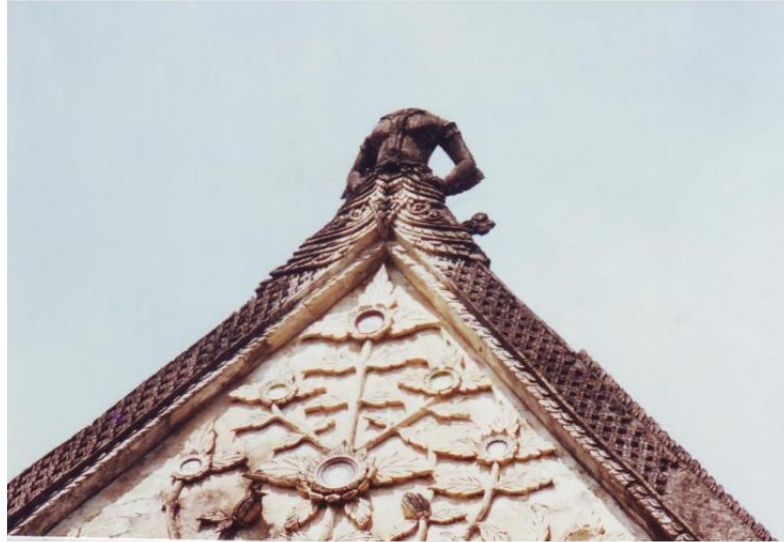
ซ้อฟ้า เหลือเฉพาะด้านทิศตะวันตก เป็นรูปบุคคลหรือเทวดา ส่วนศิระชะง่ารด เจ้าอาวาสบอกว่าศิระชะง่าของประติมากรรม มีผ้าโพก คล้ายพวงมอญ พม่า